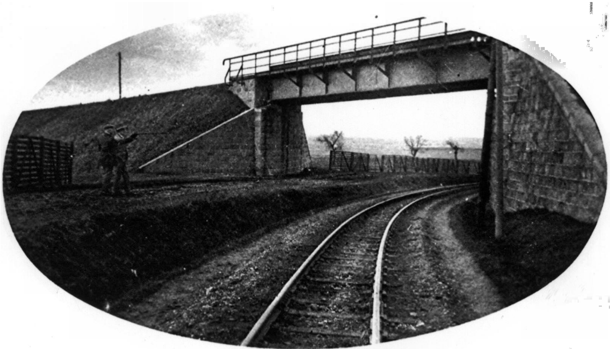
Brücke Randsiedlung um 1925