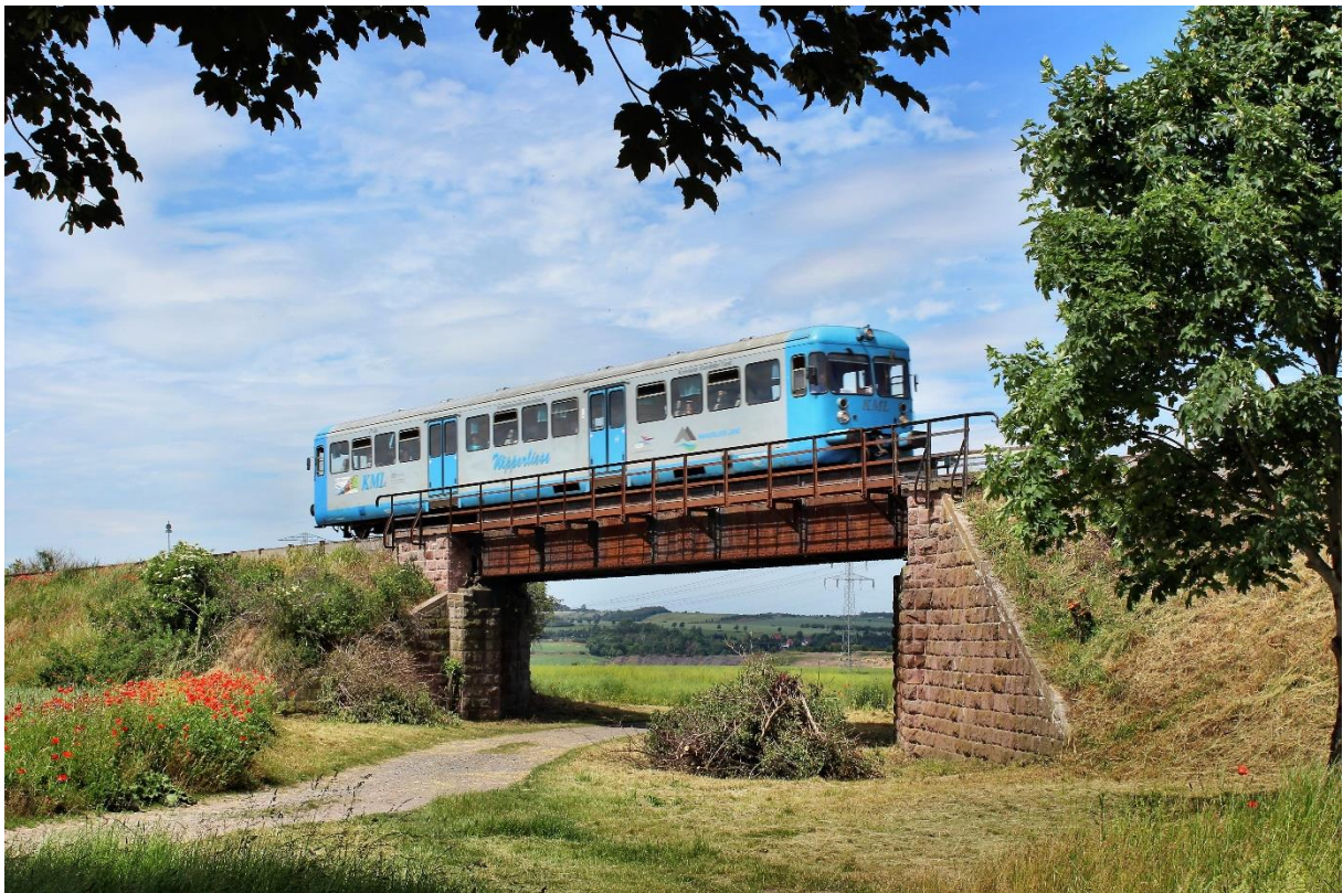
Brücke Randsiedlung 2017, Foto Steve Kloseek