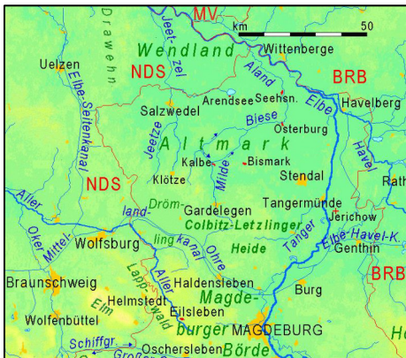
Physische Geographie der Altmark und angrenzender Regionen

Die Hochwassergefahren an und hinter den Deichen und die wasserwirtschaftlichen Rahmenbedingungen der Niederungsgebiete in der Altmark werden den Teilnehmern dann in den weiteren Vorträgen vorgestellt. Zwei Exkursionen zu verschiedenen landeskulturellen und wasserwirtschaftlichen Zielen sollen anschließend und am nächsten Tag einen ergänzenden Eindruck zur Tagung vermitteln.