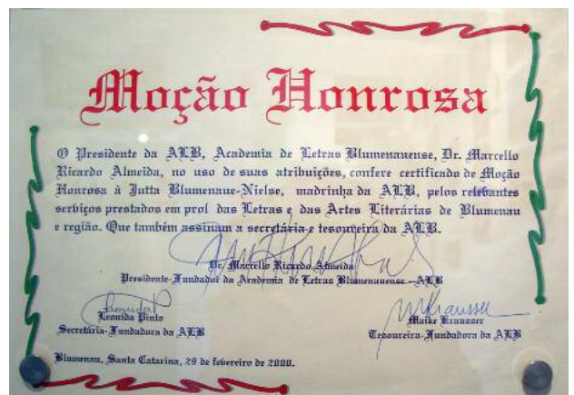
Annerkennung der Blumenauer Akademie für Literatur „für die relevante Tätigkeit zugunsten der Literatur in Blumenau und Region.“ Interessant ist die Bezeichnung „madrinha“ / „Mütterchen“ ?