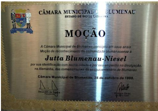
Annerkennung des Stadtrates von Blumenau "für die Identifikation mit unserer Stadt und das Engagement, die Gedenkfeier zum 150-jährigen Jubiläum in Deutschland zu verbreiten."