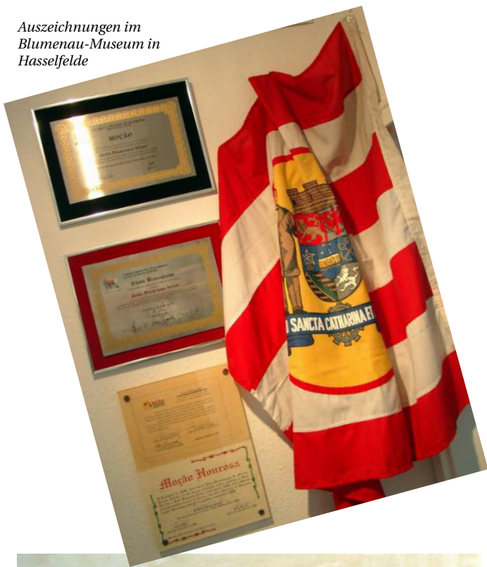
Auszeichnungen im Blumenau-Museum in Hasselfelde