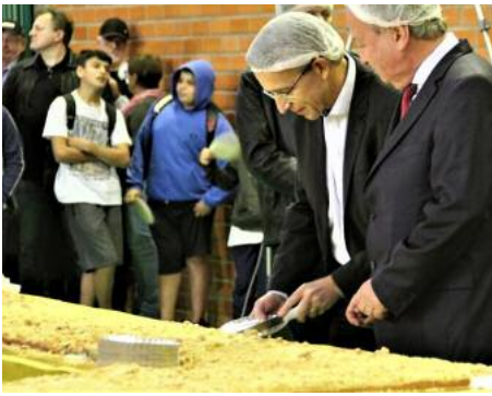
Anschnitt des Maxi-Streuselkuchens in Vila Itoupava