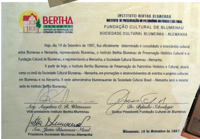
Vereinbarung zwischen dem Instituto Bertha Blumenau und der Blumenau Gesellschaft. Es geht um gemeinsame Arbeit bei der Förderung und Entwicklung von Events und kulturellen Projekten in Blumenau und in Deutschland. (Das Instituto Bertha Blumenau gibt es nicht mehr, es ist heute das Instituto Histórico de Blumenau.)