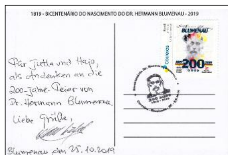
Sonderbriefmarke und -Stempel zum 200. Geburtstag von Hermann Blumenau