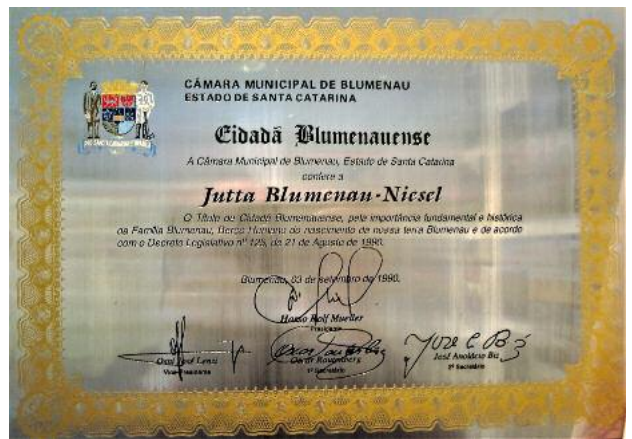
Verleihung des Titels 'Blumenauer Bürgerin' durch den Stadtrat "für die grundlegende und historische Bedeutung der Familie Blumenau, dem menschlichen Grundstein unserer Stadt Blumenau."