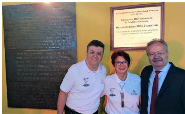
Übergabe einer Gedenktafel vom Wirtschafts- und Wissenschaftszentrum/WWZ