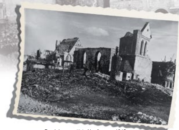
Das kriegszerstörte Nordhausen 1945

Während der Veranstaltung werden Fotos für die Öffentlichkeitsarbeit angefertigt. Wenn Sie nicht möchten, dass Fotos, auf denen Sie zu erkennen sind, veröffentlicht werden, teilen Sie uns das bitte im Vorfeld schriftlich mit.