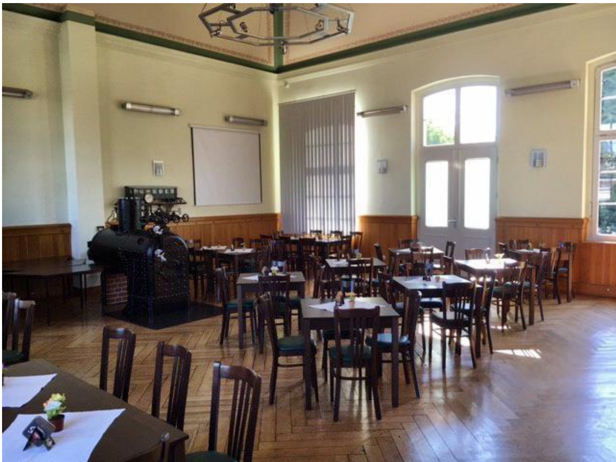
Historischer Wartesaal im Bahnhof Klostermansfeld in Benndorf, Fotos MBB-Archiv

Kontakt: Mansfelder Bergwerksbahn e. V., 034772 27640; mansfelder@bergwerksbahn.de