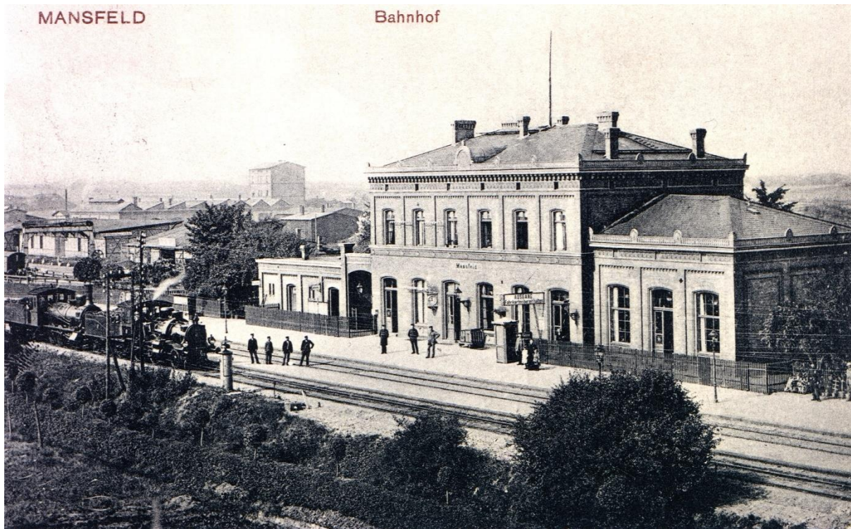
Bahnhof Mansfeld, heute Klostermansfeld, um 1900 mit einem Zug auf der Kanonenbahn.